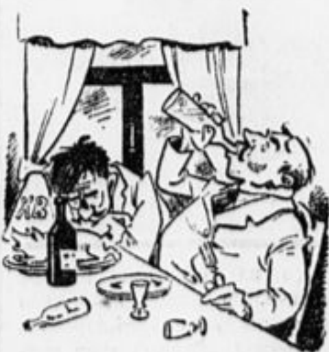
Штаны превратились в вино, И, булькая, льется оно. Отец и гости пьяны. Прощай, штаны!