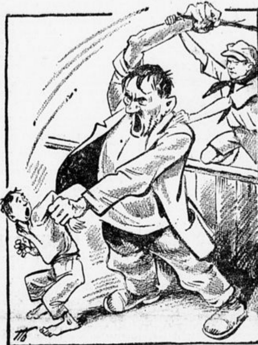
Свой быт по-новому устрой, Будь пионером до конца.