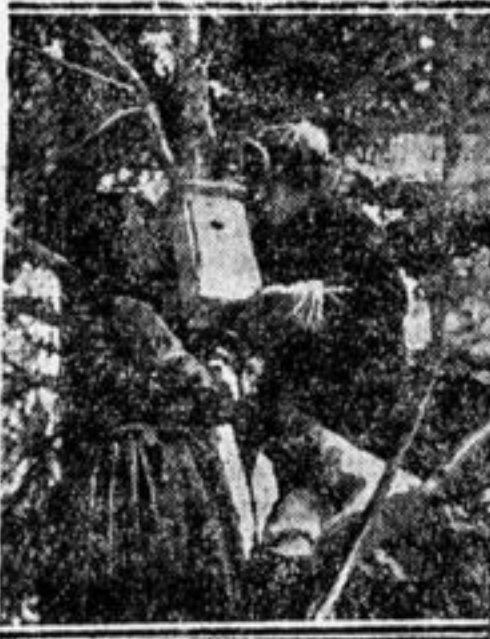
Два друга вешают скворешню.

И скворец, печалью удрученный, Уронил большого червяка С высоты на луг — ковер зеленый. Широко поразостлалось поле, Засыпали пестрые цветочки. На суку прижалась в сильном горе Эти два пернатые комочка. Что-то думали. И тихо наблюдали, Как внизу деревня засыпает. Видно, бедные, еще не знали О ребятах, что их защищают. Д-р П. ГРИНИВИЦКИЙ.