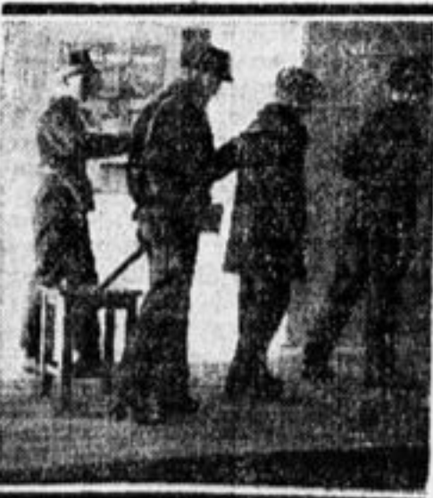
Момент из постановки драм. кружка 42 шк. «Пионеры Запада».