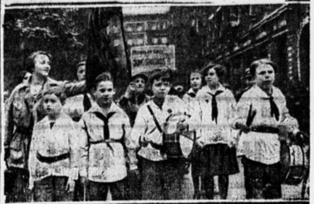
Демонстрация пионеров в Берлине.