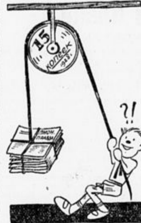
Вот по физике урок— Из него наглядно видно: Даже самый малый блок Поднимает груз солидный.

Годовщина «Пионерской Правды» приближается.