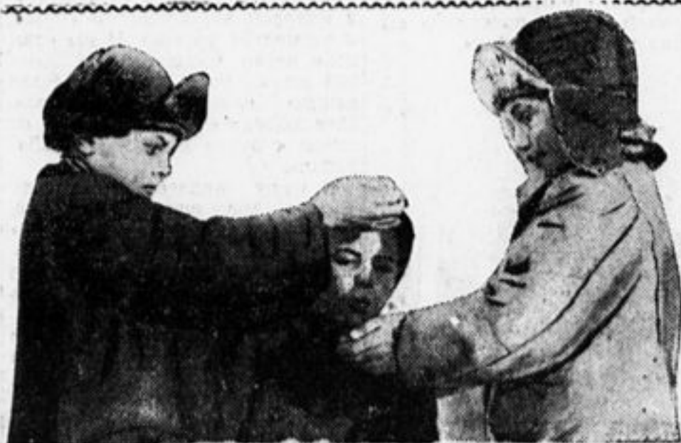
Отбирают семена для нового сева.