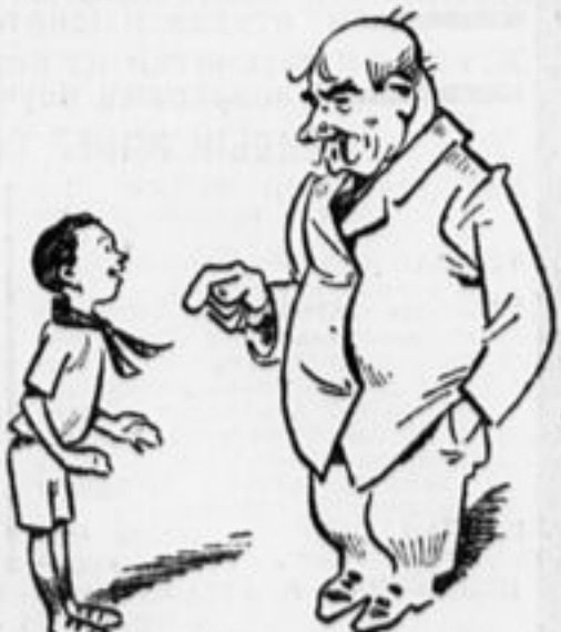
Дыра на каждой штанине Тебе к каникулам ныне, Учтя приближение весны, Куплю штаны.