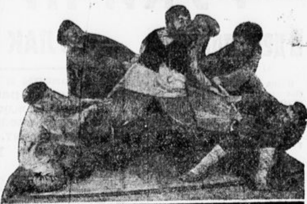
Последний акт. Арест председателя-кулака.