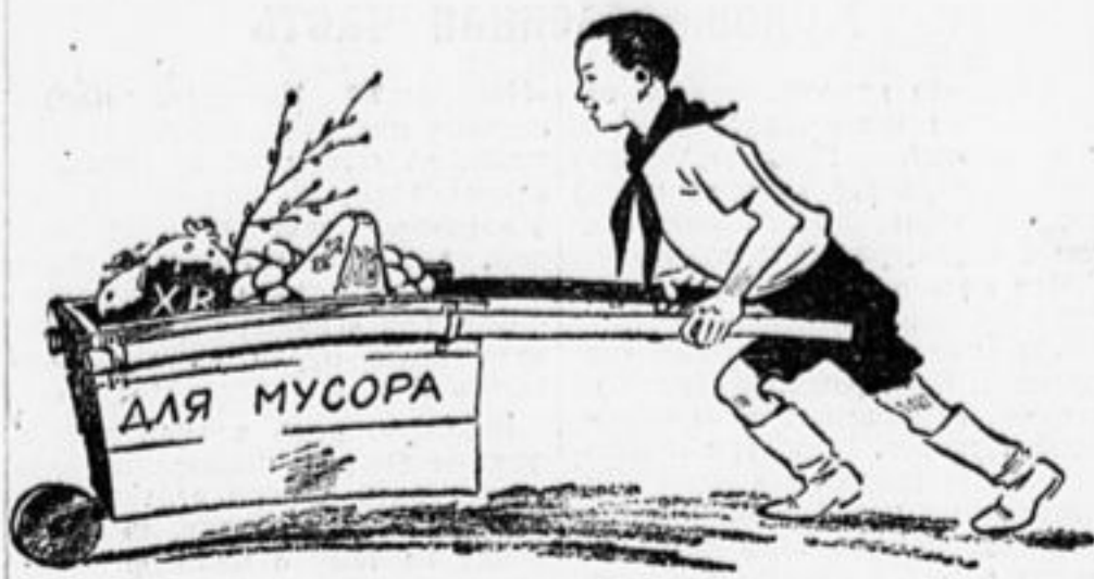
Рисунок, не требую щий пояснений.